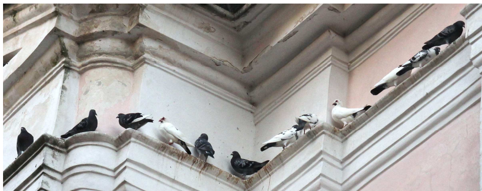
Kostel je oblíbeným místem setkávání nejen lidí, ale i holubů. (září 2023)